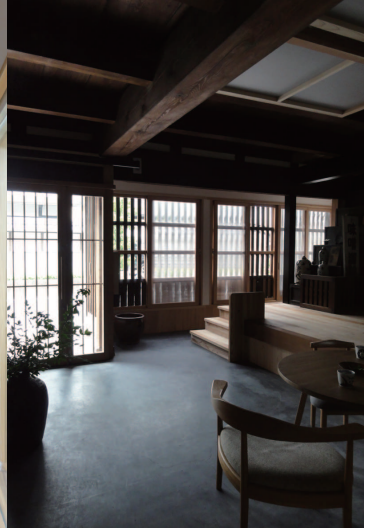
MISAWA FUMIKO MSD/Ms建築設計事務所 代表